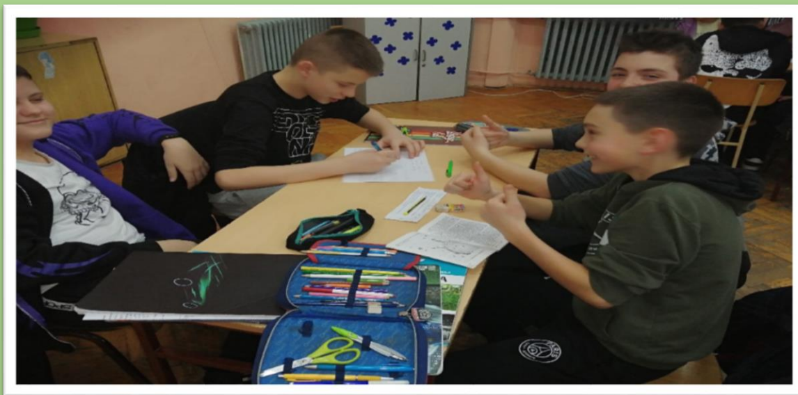
Групни рад , и рад и забава