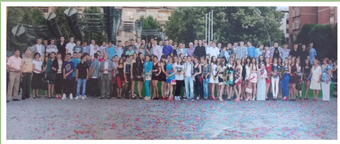
Матура, 4. јуни 2012. године