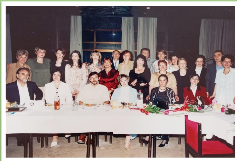
Матурско вече, 2004. година