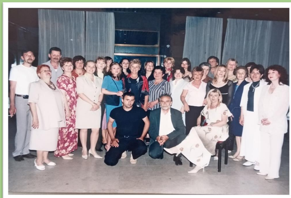
Матурско вече, 2005. година